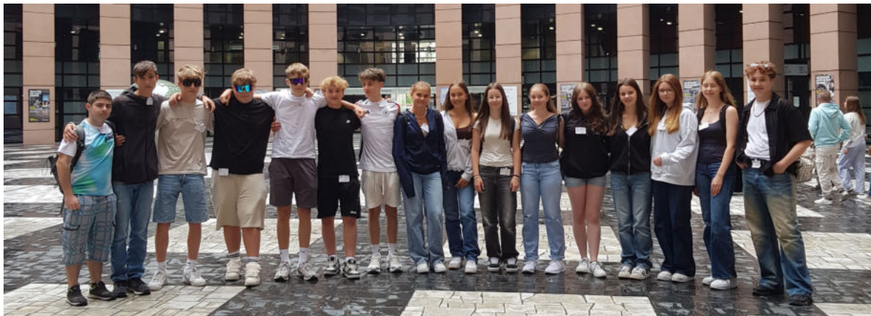
Die Schülerinnen und Schüler im Innenhof des Europaparlaments

Schuljahr: 2025/26 // Ausgabe: Dezember 2025