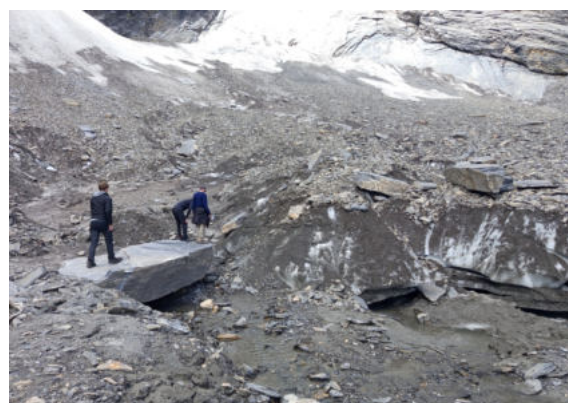
(Rest-) Gletscher, Gletschertor, Schuttbedeckung